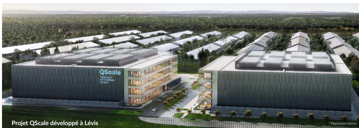
Projet QScale développé à Lévis